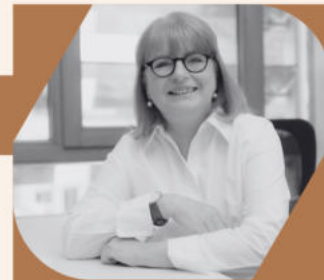
Elke Bay Mediengestaltung